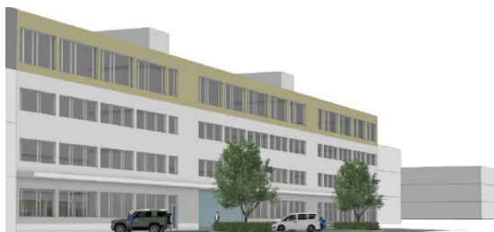
Tillaga Kanon arkitekta – ásýnd að Grensásvegi