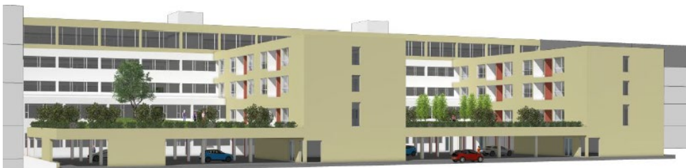
Tillaga Kanon arkitekta – ásýnd að garði

Óskað er eftir afstöðu skipulagsfulltrúa á eftirfarandi atriðum: