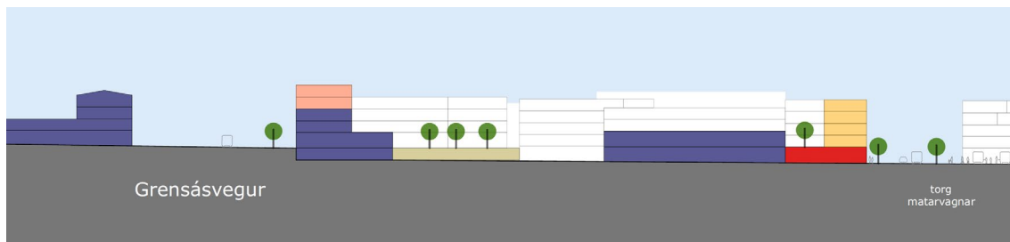
Rammaskipulag Skeifunnar - snið