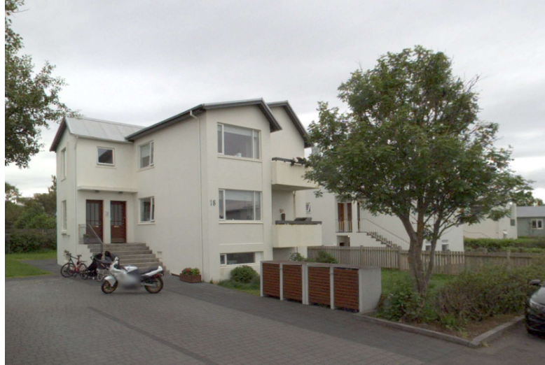
Götumynd (júlí 2022)