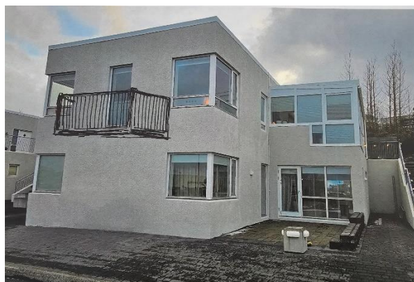
Tillaga að svölum

Sbr. greinargerð gildandi deiliskipulags er húsið hluti af raðhúsalengju á svæði 3A. Ekki kemur fram í greinargerð skilyrði um svalir. Því skal fylgja leiðbeiningum hverfisskipulags varðandi útfærslu. Samþykki allra eigenda lóðarinnar, ásamt eigenda aðliggjandi lóða, skal fylgja byggingaleyfisumsókn.