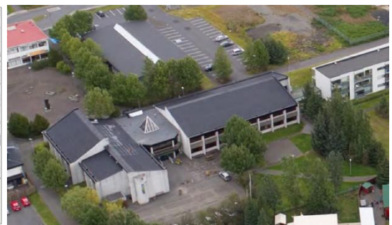
Gerðuberg 3-5 séð frá lofti.