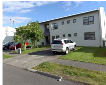
Götumynd á ja.is, Frostafold 3