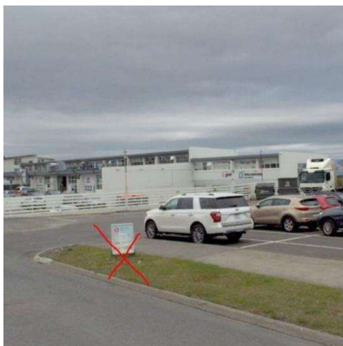
Götumynd, fylgdi fyrirspurn