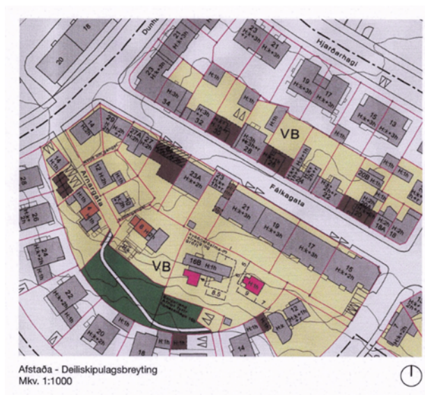
Afstöðumynd af lóð nr. 23 við Fálkagötu í gildandi deiliskipulagi sýnir byggingarreit á lóðinni.

Breytingin felur í sér stækkun byggingarreits um allt að 34,2m 2 og fer heildarstærð hússins þá úr 165,8m 2 í 200m 2 . Nýtingarhlutfall fer úr 0,54 í 0,65. Hámarks mænishæð viðbyggingar er um 4,7m frá jörðu eða í línu við neðri brún þakskeggs núverandi húss. Hámarks hæð neðri brúnar þaks viðbyggingar er um 3,25m frá jörðu eða í línu við efri brún þaks núverandi geymsluskúrs. Viðbygging sunnan núverandi geymsluskúrs er í sömu hæð og núverandi skúr. Að öðru leyti gilda eldri deiliskipulagsskilmálar samþykktir í borgarráði 2008.