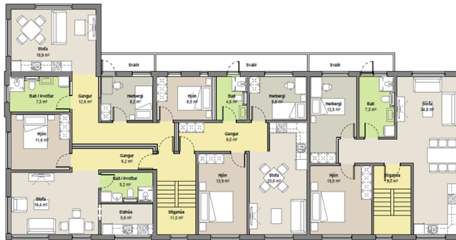
Grunnmynd 1.-3. hæðar húsins, upprættir dags. 7. júlí 2025