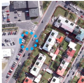
Loftmynd, júlí 2023