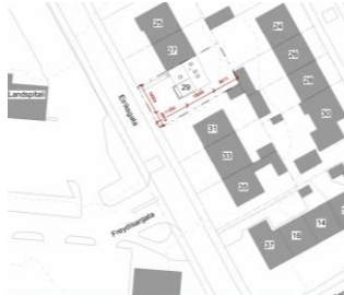
Afstöðumynd og snið B-B skv. uppdráttum dags. 11.07.2024