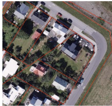
Loftmynd úr Borgarvefsjá