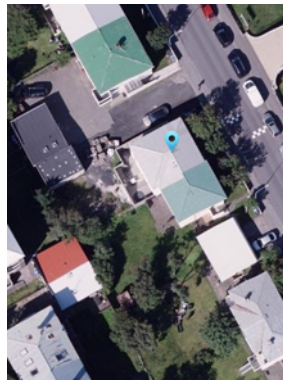
Loftmynd, Egilsgata 14