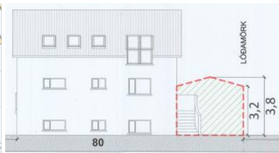
Skýringamynd - Ásýnd frá götu