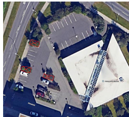
Skýringarmynd úr fyrirspurn