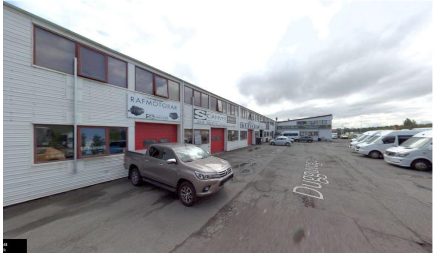
Portið inná lóðinni