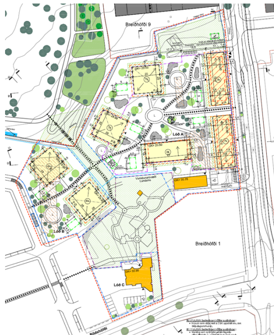
Deiliskipulag: Ártúnshöfði svæði 7A