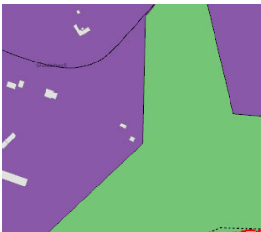
Aðalskipulag Reykjavíkur 2040

Sótt er um leyfi fyrir áður gerðum breytingum sem felast í að hlaða hefur verið gerð upp einangruð og klædd að utan með báruklæðningu og notkun breytt í vinnustofu auk þess sem byggð hefur verið geymsla við suðaustur hlið húss á lóðinni Bjóla 2 á Kjalarnesi