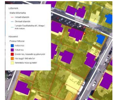
Listi yfir verndun