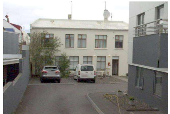
Götumynd tekin af Já.is