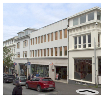
Bankastræti 7 (ja.is)