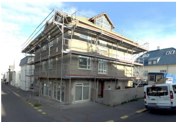
Götumynd, tekin af Já.is