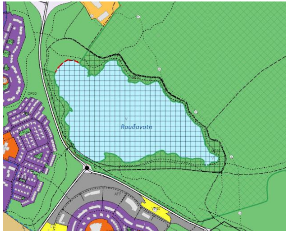
Aðalskipulag Reykjavíkur 2040.

Lögð fram umsókn skrifstofu framkvæmda og viðhalds dags. 16. desember 2022 um framkvæmdaleyfi fyrir Austurheiðar, útivistarsvæði 2022, áfanga 2. Einnig eru lögð fram útboðsgögn og teikningasett dags. september 2022, sem inniheldur m.a. grunnmyndir, yfirlitsmyndir, snið.