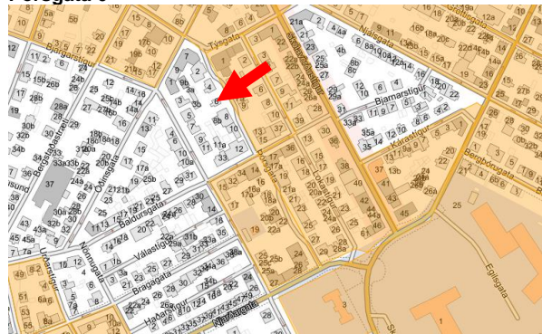
Ekkert deiliskipulag er í gildi fyrir lóðina. Mynd úr kortasjá Skipulagsstofnunar.