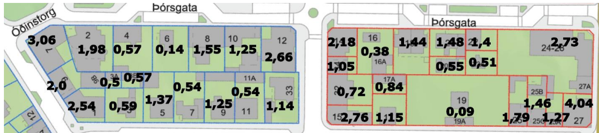
Samantekt á nýtingarhlutfalli úr fasteignaskrá suðvesturreita við Þórsgrötu

byggð en fellur ekki að byggðarmynstri suðvesturhlíðar Þórsgrötu þar sem hornlóðirnar eru mikið byggðar, en byggðarmynstur þar á milli er mun lægra.“ Skuggavarpteikningar af uppbyggingu staðfesta að tillaga að byggingu, eins og fjallað var um í febrúar, er of há og of umfangsmikil. Uppbygging í tillögunni er miðuð við hæstu og stærstu húsinn í kring. Mikilvægt er að laga tillögu að uppbyggingu á lóðinni betur að byggðarmynstri, minnka byggingarmagn og lækka hús.