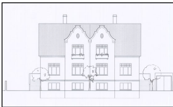
Öldugata 30 A og 30 – hlið að götu