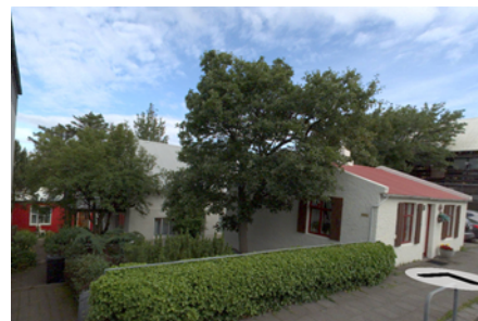
Óðinsgötu 18, 18a, 18b og 18c (ja.is)