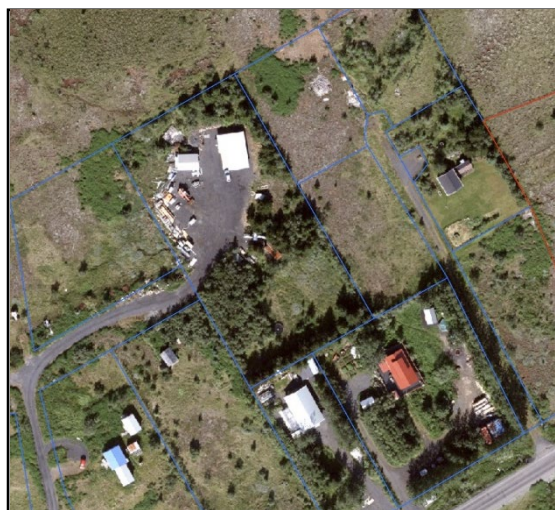
Loftmynd af svæðinu