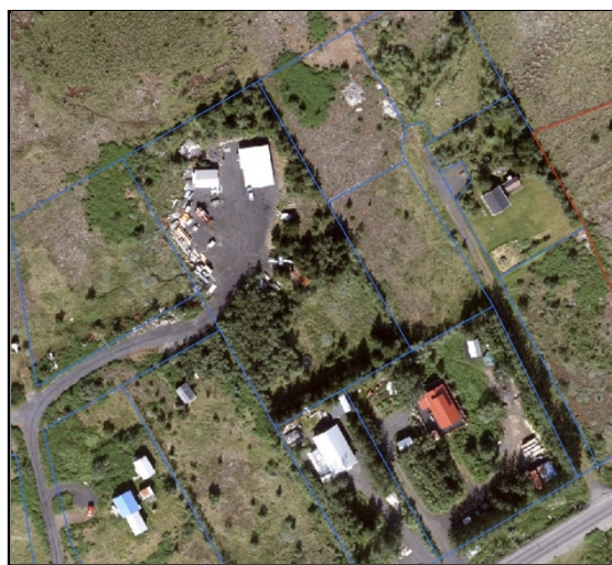
Loftmynd af svæðinu