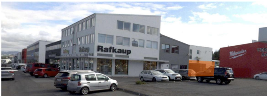
Ásýnd norð- vestur frá Ármúla