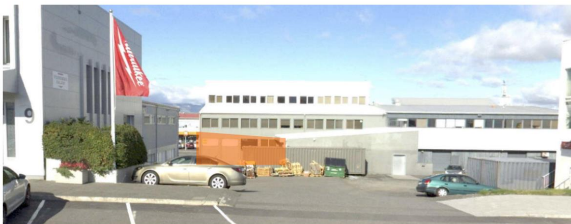
Ásýnd suð- vestur frá Síðurmúla