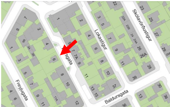
Kort af Þórsgötu 6 og nágrenni.

Uppbygging svæðisins spannar langt tímabil í sögu borgarinnar en hverfið var að mestu fullbyggt fyrir miðja síðustu öld. Húsið á Þórsgötu 6 er einlyft bárujárnsklætt timburhús með kjallara og risi frá árinu 1920. Samkvæmt teikningum hefur húsið haldist að mestu óbreytt frá upphafi að undanskilinni viðbyggingu og lítils kvists á þaki suðurhlíðar. Að götu standa steypdir garðveggir. Í garðinum eru há tré. Vegna aldurs núverandi húss er þörf á umsögn minjastofnunar vegna allra framkvæmda á því. Húsið að Þórsgötu 6 er einlyft timburhús með risi á undirstöðum úr steini, byggt árið 1920.