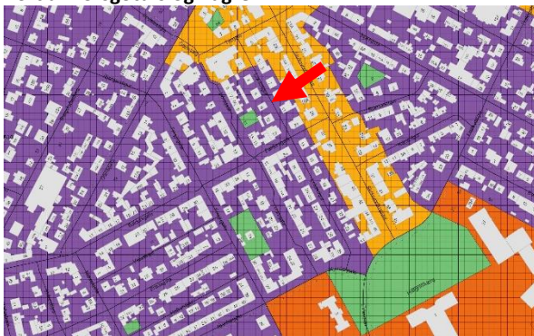
Skipulagsuppráttur úr Aðalaskipulagi Reykjavíkur 2040.