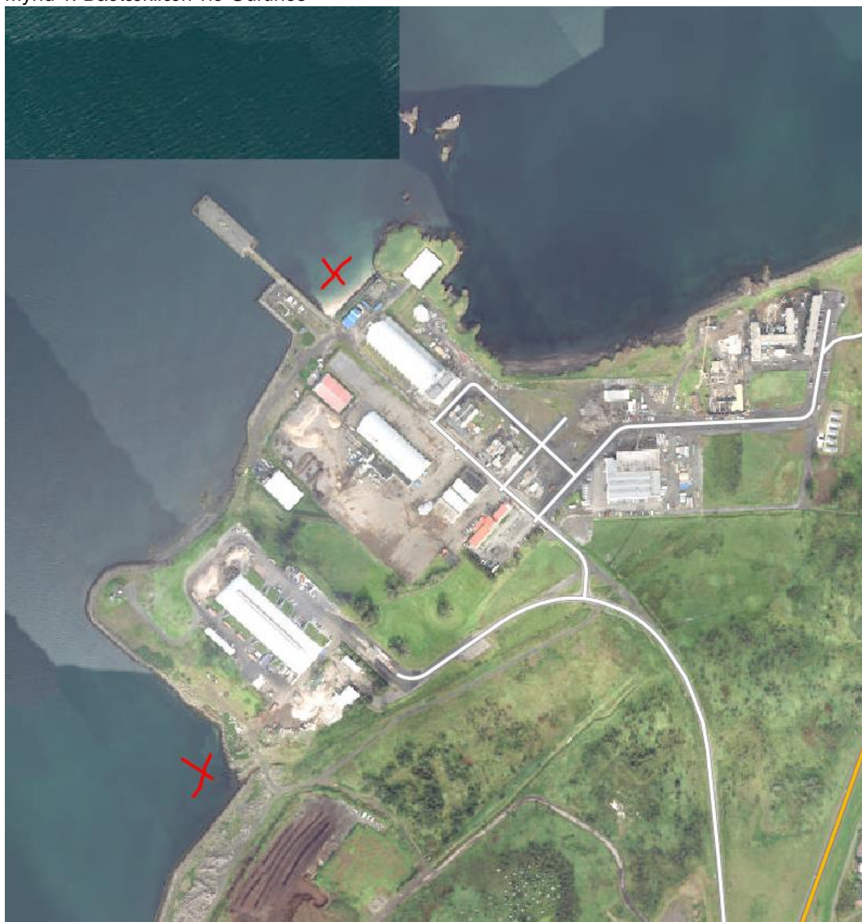
Mynd 1. Baðtækifæri við Gufunes