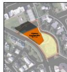
SKUGGAVARP - miðað við hámarkshæð á byggingarreit