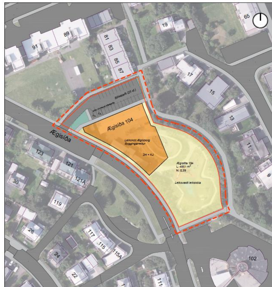
SKÝRINGARMYND, mkv. 1:1000