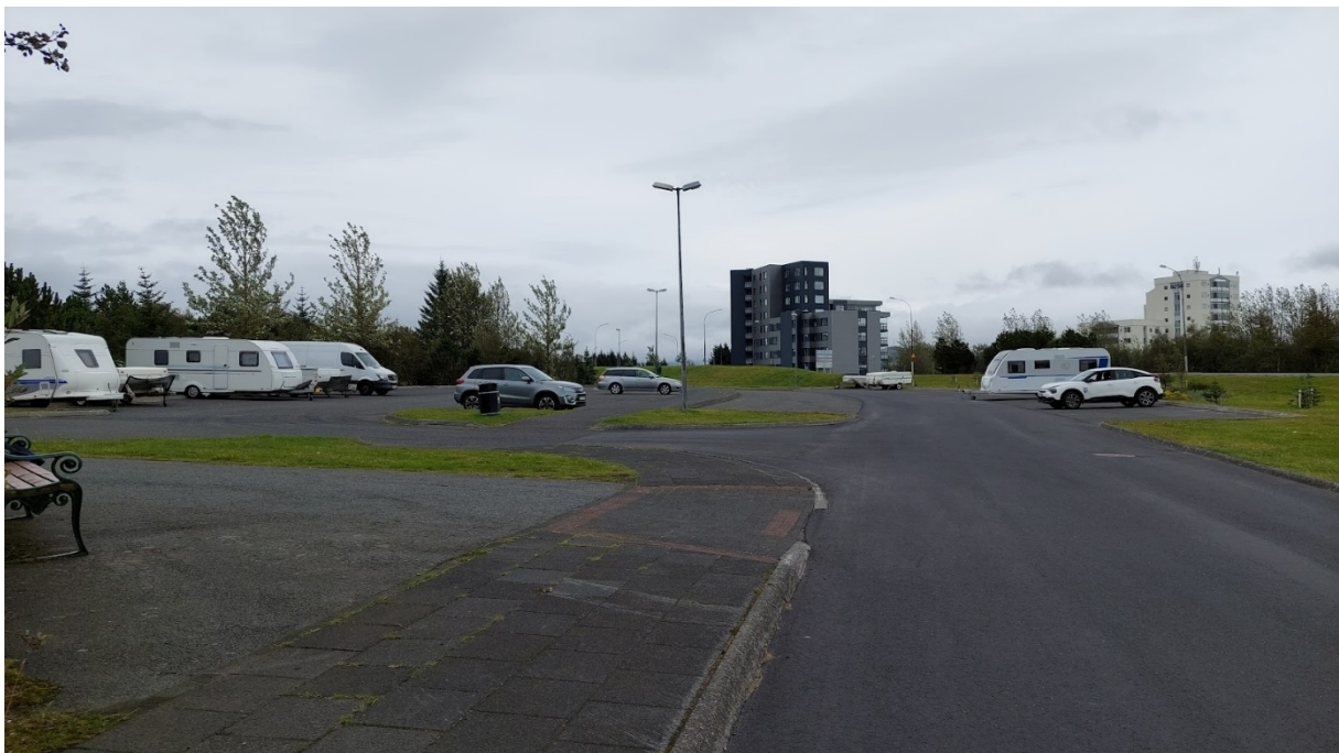
Bilastæði við Kistuhyl, miðvikudaginn 6. september.