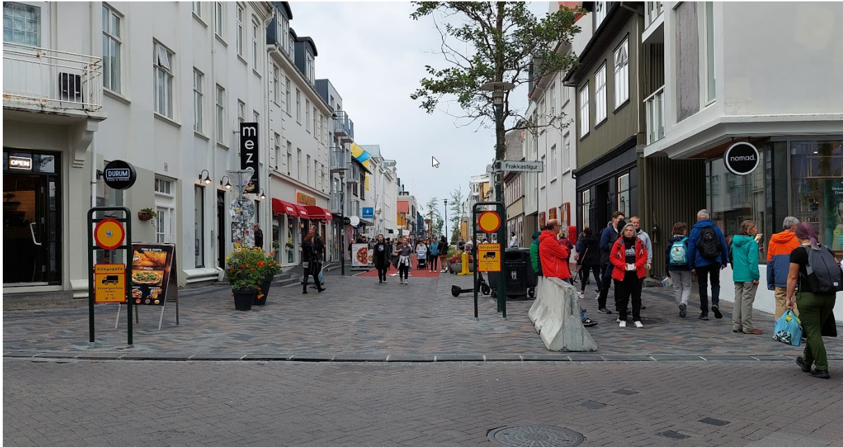
Laugavegur við Frakkastíg horft til vesturs. Nýlegar breytingar á yfirborði sem marka betur upphaf göngugötunnar.

undanförnu á mörkum göngugötunnar og á henni sjálfri miðla mun betur en áður til vegfarenda að um göngugötu sé að ræða. Fyrir í sumar var yfirborði Laugavegar næst Frakkastíg breytt svo það væri skýrt bílstjórum að vestan Frakkastígs sé Laugavegur göngugata. Sambærilegar breytingar á yfirborði hafa einnig verið gerðar á Skólavörðustíg við Bergstaðastræti. Einnig hefur yfirborð göngugötusvæðisins fengið rauðan lit þannig að enn skýrara er að ekki er um hefðbundna götu að ræða. Einnig er von á nýrri reglugerð um umferðarmerki og notkun þeirra en drög að henni liggja fyrir hjá Innviðaráðherra. Með henni verður heimilt að nota sérstök göngugötumerki sem munu gefa enn skýrari skilaboð um göngugötu en núverandi merki.