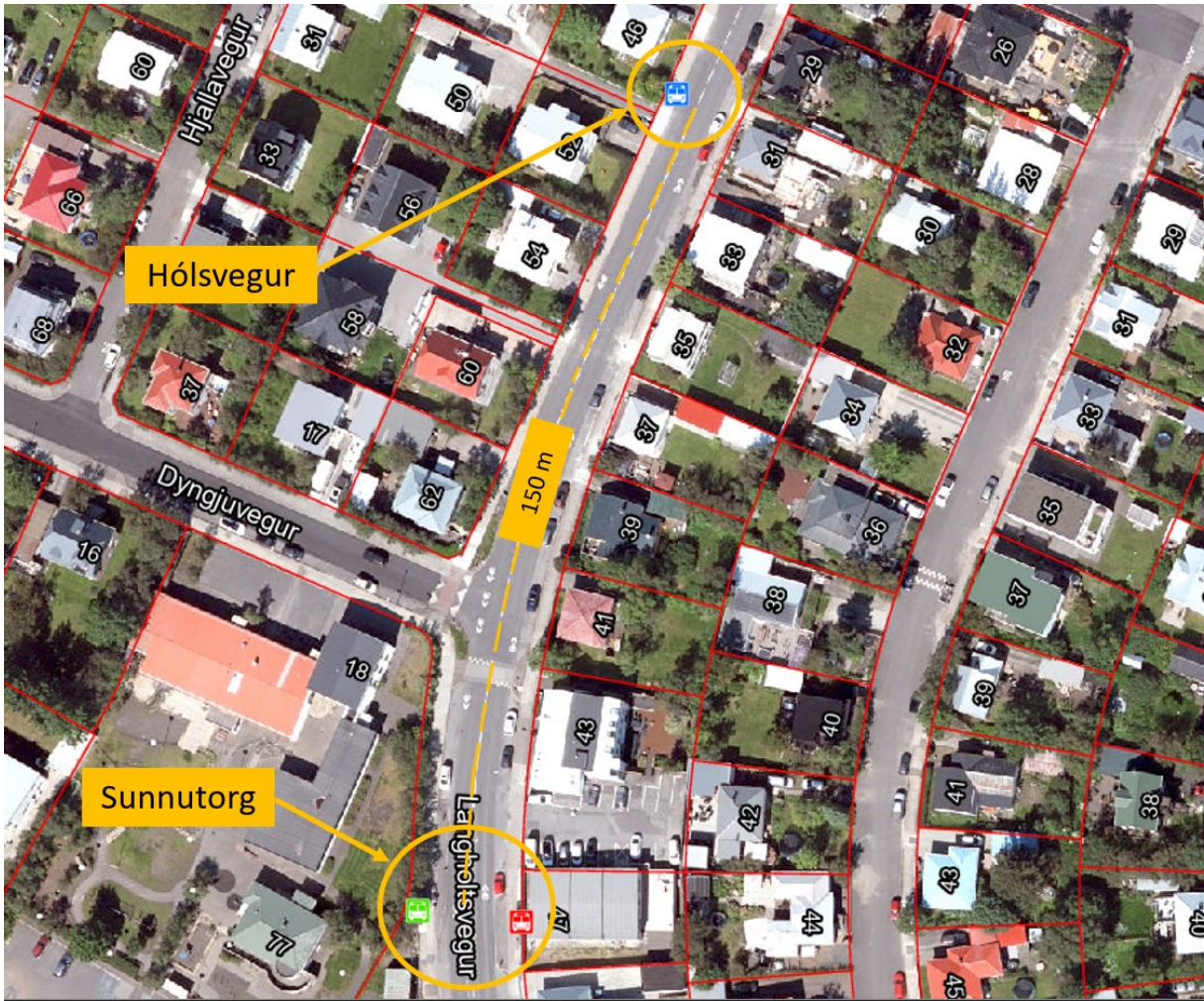
Mynd 1 Yfirlitsmynd af stoppistöðinni Hólsvegi við Langholtsveg sem sýnir vegalengd að næstu stöð, Sunnutorgi