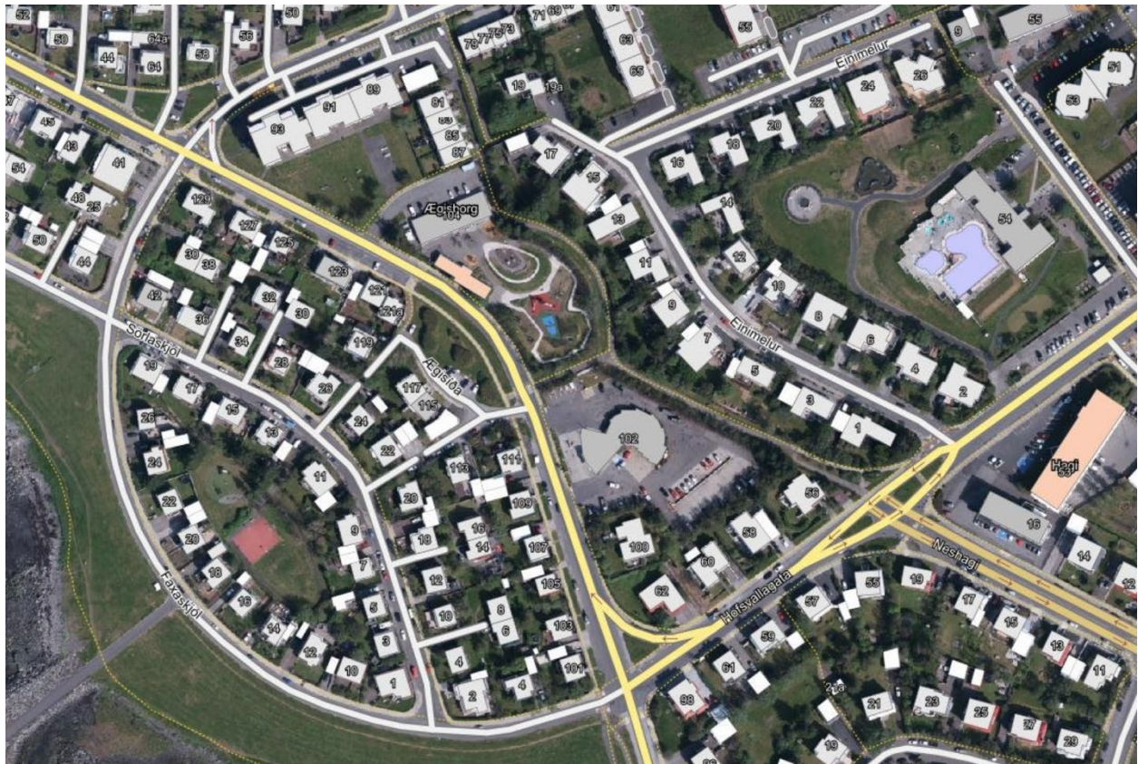
Mynd 2. Skjáskot úr Borgarvefsjá af lóðunum tveimur. Hinn nýji leikskóli gæti samnýtt leikskólalóð Ægisborgar.