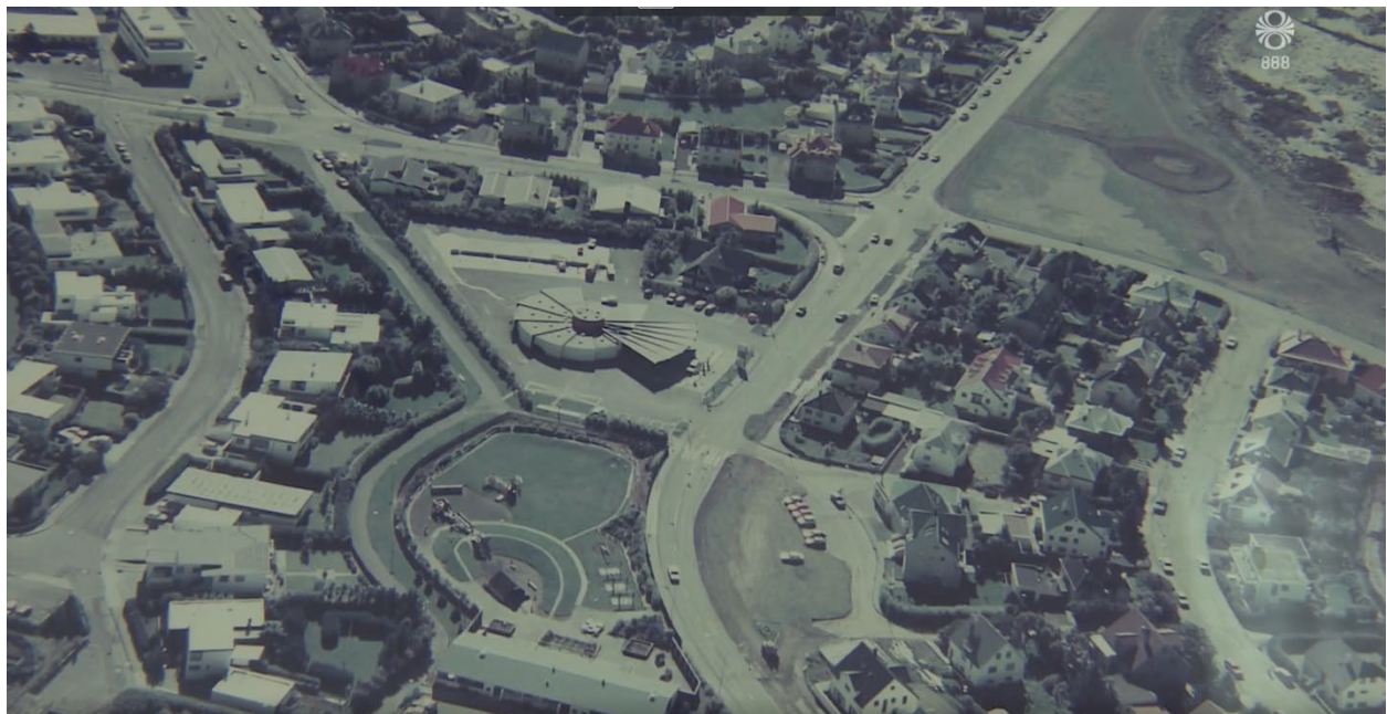
Mynd 3. Skjáskot af loftmynd í frétt RÚV. Eins og sést er nægt pláss fyrir tvær til þjár Ævintýraborgir og aðkoma bæði fyrir gangandi og akandi væri mjög góð. Húsið á lóðinni er í laginu eins og Kuðungur sem