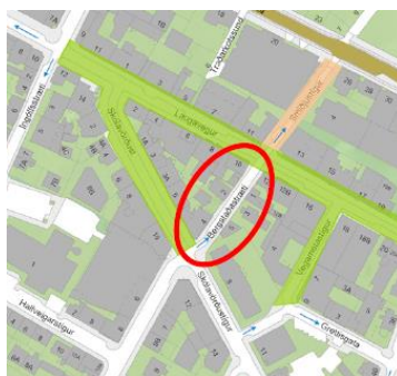
Skýringarmynd – nánari staðsetning