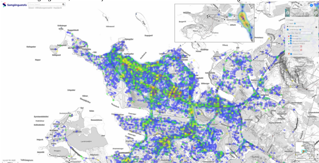
Hitakort Samgöngustofu, öll umferðarslys 2021 til og með 2025