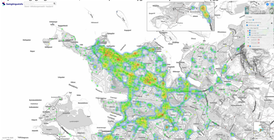
Hitakort Samgöngustofu, umferðarslys sem hafa í för með sér meiðsli á fólki 2021 til og með 2025