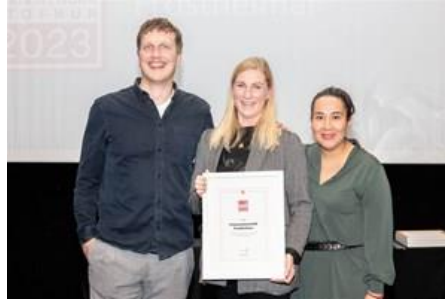
Mynd: Stjórnendur Frostheima taka á móti verðlaunum á Stofnun ársins 2023