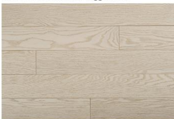
Viðargólf á vinnurýmum