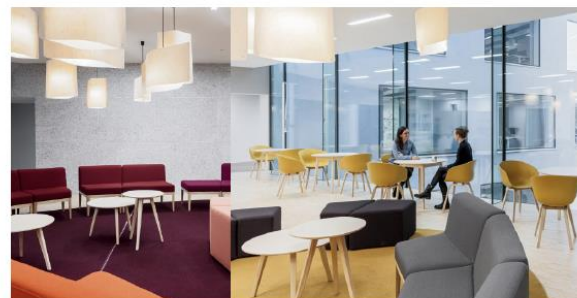
náttúrulegir litir endurteknir í húsgagnavali