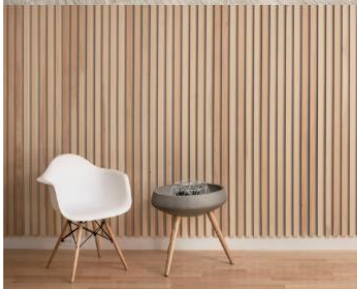
Viðarrimar á völdum veggflötum