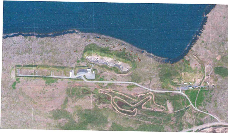
Mynd 2 er yfirlitsmynd fyrir bæði skotsvæði. Vinstra megin er skotsvæði Skotfélags Reykjavíkur og hægra megin er skotsvæði Skotveiðifélags Reykjavíkur. Sýnatökustaðir þar sem högl voru talin eru merktir með brúnum punkti.

Heilbrigðiseftirlit Reykjavíkur Umhverfiseftirlit