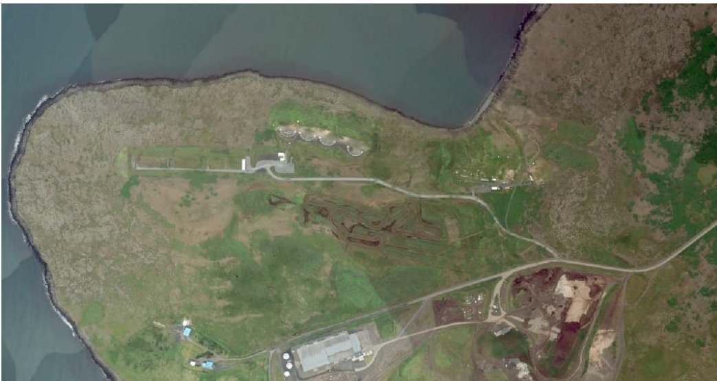
Núverandi aðstaða skotsvæðanna á Álfsnesi. Loftmynd tekin árið 2021.

Í greinargerð SR með umsókn kemur fram að félagið er elsta íþróttafélag landsins stofnað árið 1867. Félagsmenn í dag eru um 1.500 talsins, en iðkendur á landsvísu í skotíþróttum eru yfir/ um 5.000. Félagið heldur úti völlum í skotfimi á Álfsnesi og er um að ræða fjóra ólympíska skeet - skotvelli þar sem skotið er af haglabyssum. Vellirnir eru grafnir niður á klöpp og manir reistar utan um þá til að draga úr hljóðbylgjum sem gætu borist í næsta nágrenni. Áætlað var að efni það sem flutt var á skotsvæðið þegar það var byggt nemi um 350 þ. m 3 og var það allt notað til að byggja svæðið þannig upp að um varanlega staðsetningu væri að ræða. Keppnir fara fram á ýmsum tímum og svæðið/ félagið heldur utan þjálfun prófdómara og námskeið Lögreglunnar og Umhverfisstofnunar.