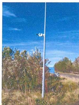
Mynd 11 sýnir SP4 hljóðmæli uppsettan við Skriðu og Stekk

Heilbrigðiseftirlit Reykjavíkur Umhverfiseftirlit