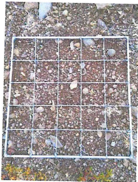
Mynd 3 sýnir talningareit staðsettan á dæmigerðum sýnatökureit (vinstri) og hvernig reitum var gefið nafn (hægri)