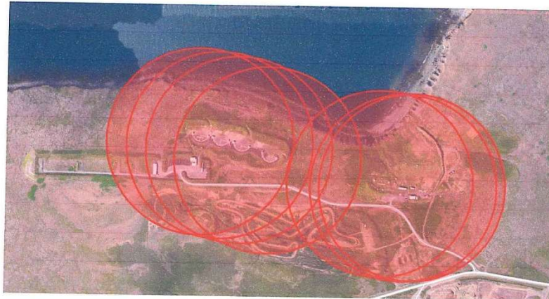
Mynd 4 sýnir drægni haglaskota ef miðað er við 250 m radius

Þegar áætlaður fjöldi hagla á fermetra (m 2 ) er skoðaður fyrir bæði svæðin sést að talsvert magn af höglum er að finna í jarðveginum við skotsvæðin en það var ekki óviðbúið. Greinilegur munur er á áætluðum fjölda hagla á fermetra (m 2 ) milli skotsvæða. Rétt er að taka fram að aðstæður eru mismunandi milli skotsvæða og er að jarðvegsmön sem er við skotvöll Skotfélags Reykjavíkur (SR) taki stóran hluta af höglum sem þaðan berst. Við skotsvæði Skotveiðifélags Reykjavíkur (Skotreyrn) er engin slík jarðvegsmön og sýnatökustaðir í beinni sjónlínu við skotsvæðið.