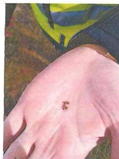
Mynd 1 sýnir dæmi um opinn jarðveg á svæðinu með greinilegum höglum á yfirborði