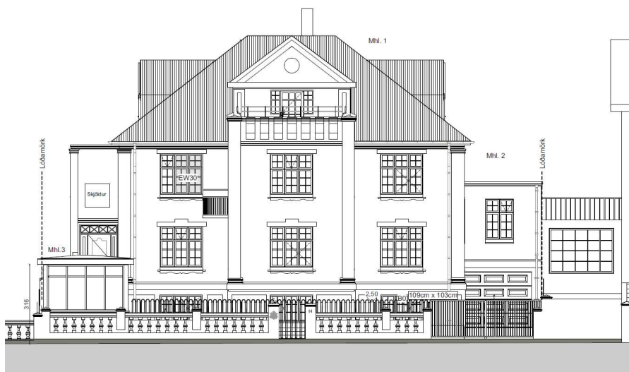
Götuásýnd sbr. umsókn

Lögð er rík áhersla á að garðveggur við götu haldi sér í upprunalegri mynd. Skv. umsókn stendur ekki til að breyta garðveggnum að götu en koma fyrir hærri girðingu u.þ.b. 2,5 m innar á lóðinni. Sem fyrr segir eru háar öryggisgirðingar að götu óæskilegar í gróinni íbúðarbyggð. Forsenda fyrir því að skipulagsfulltrúi heimili hærri girðingu innan við steiptan garðvegg er að hæð hennar sé ekki meiri en girðinga í lóðarmörkum að nr. 12 og 16 (1,8 m) og að bilið á milli girðingar og garðveggjar sé nægilega rúmt til þess að hægt sé að koma þar fyrir gróðurbeði með stórum gróðri, runnum og blómum sem eru til prýði fyrir götumyndina og draga úr áhrifum og sýnileika nýju girðingarinnar . Ekki er nóg að hafa grasflöt á milli garðveggjar og girðingar þannig að öryggisgirðing blasi við. Þessi áhersla hefur verið rædd á fyrri fundum um breytingar á lóðinni og kemur einnig fram í fyrri umsögn skipulagsfulltrúa dags. 24. nóvember 2022.