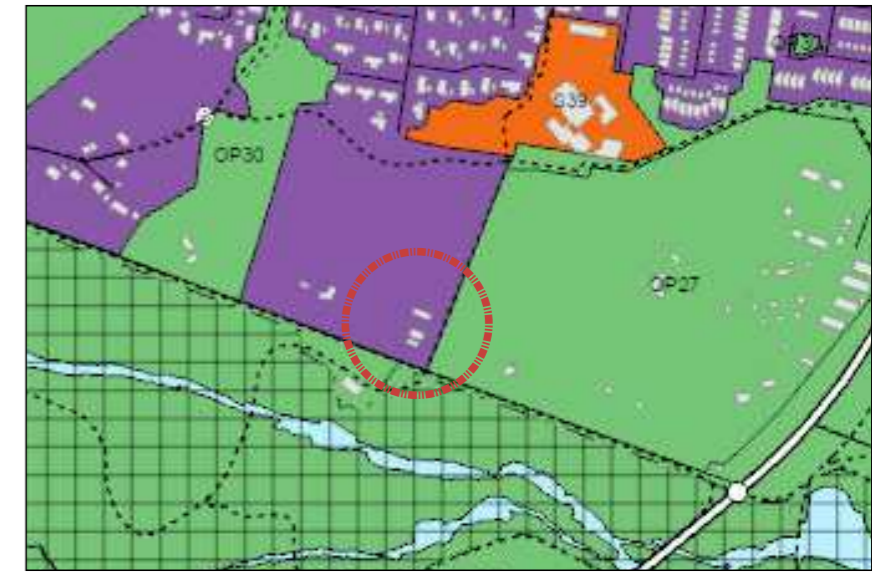
Hluti af Aðalskipulagi Reykjavíkur 2040

Að öðru leyti er vísað í gildandi deiliskipulag sem var síðast breytt á þessu svæði 28.09.2018.