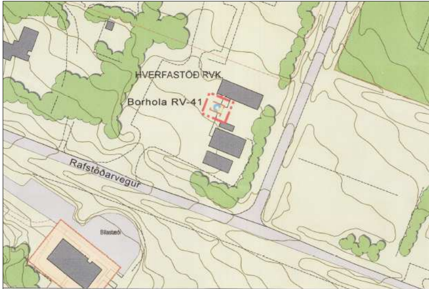
Hluti af gildandi deiliskipulagi Elliðaárdals, síðast breytt með auglýsingu í B-deild 28.09.2018, mskv 1:1000.