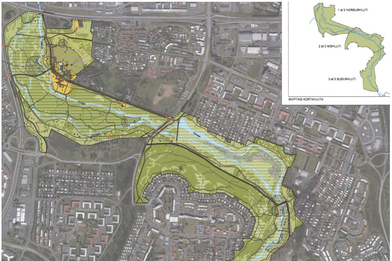
Elliðaárdalur Hluti af gildandi deiliskipulagi

Skipulagslýsingin er unnin í samstarfi við Orkuveitu Reykjavíkur