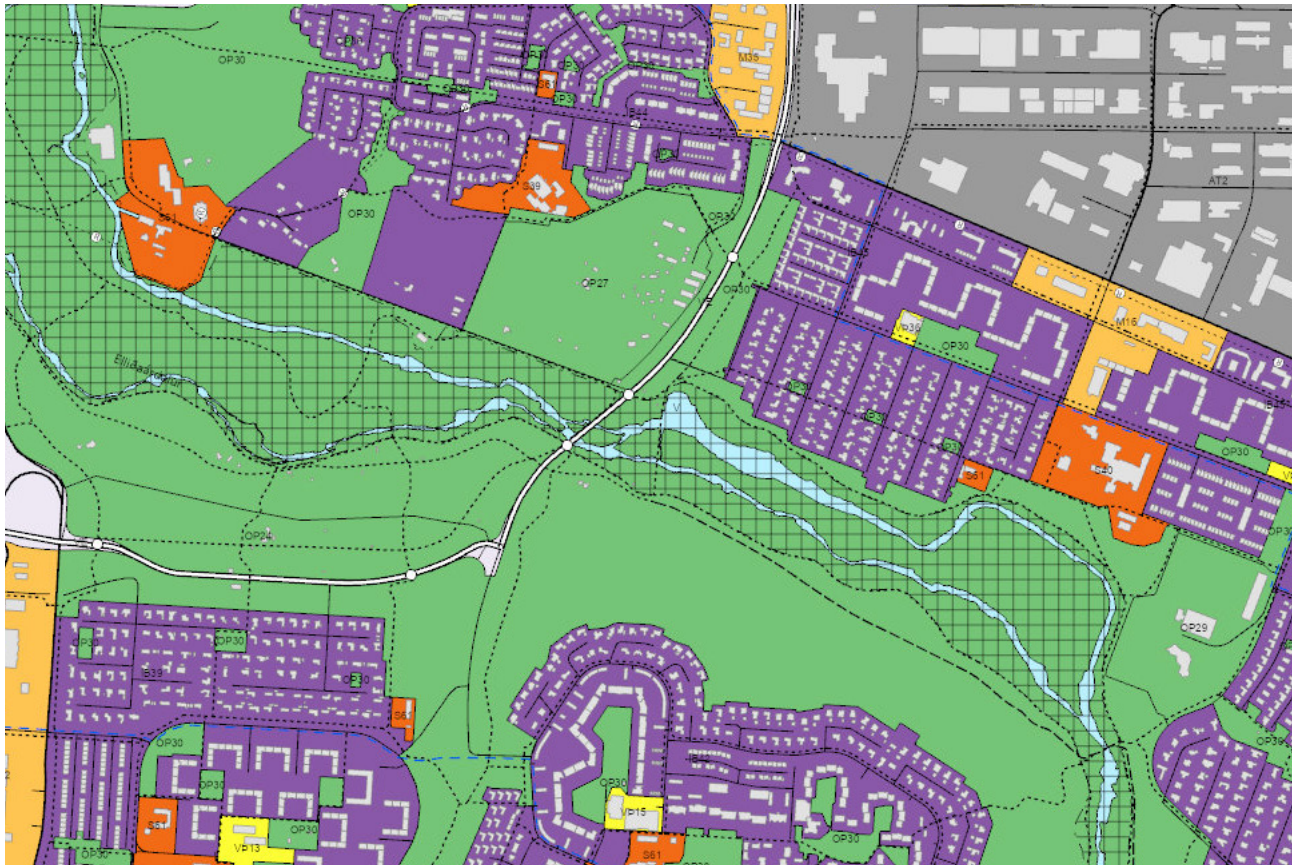
Elliðaárdalur Aðalskipulag Reykjavíkur

Á svæðinu eru friðaðar minjar, mannvirki sem tilheyrja raforkuframléiðslunni. Stíflan og lónið eru staðsett á afmörkuðu verndarsvæðis fornleifa.