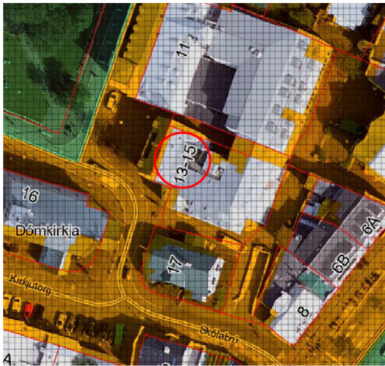
Aðalskipulag Reykjavíkur 2040

Á embættisafgreiðslufundi skipulagsfulltrúa 30. nóvember 2023 var lögð fram umsókn P13 fjárfestinga ehf., dags. 11. október 2023, ásamt bréfi Birkis Ingibjartssonar, dags. 11. október 2023, um breytingu á skilmálum deiliskipulags reits 1.140.5 vegna lóðarinnar nr. 13-15 við Pósthússtræti. Í breytingunni sem lögð er til felst að heimilt verði að vera með gistipjónustu í flokki II í íbúðum á 2. hæð hússins, samkvæmt tillögu, dags. 11. október 2023.