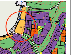
Hluti úr aðalskipulagi Reykjavíkur 2040