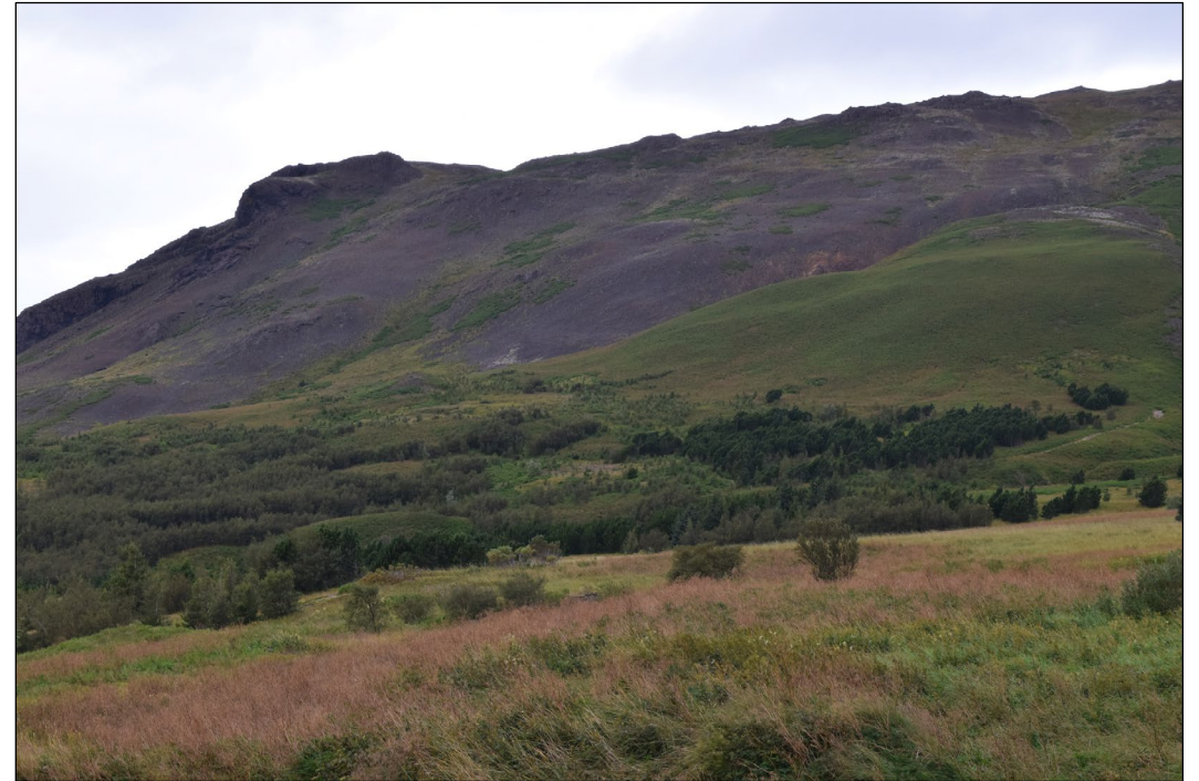
Myndin sýnir landsvæði við Mógilsá