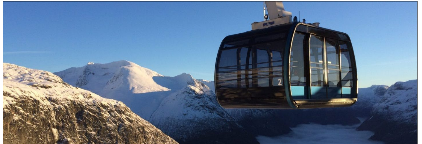
Myndin sýnir Loen Skylift, svifferju sem liggur upp Mount Hoven í Noregi