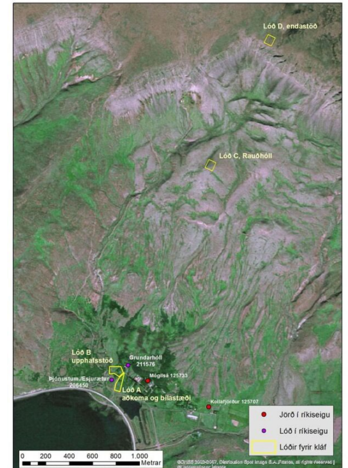
Myndin sýnir áætlaða staðsetningu þjónustustöðva kláfsins, en gert er ráð fyrir upphafsstöð við Esjurætur, millistöð við Rauðhól og endastöð efst á Þverfelli.