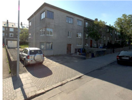
Götumynd, Leifsgata 22