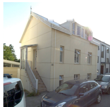
Götumynd tekin af kortasjá já.is