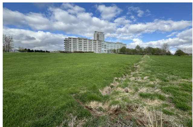
Borgarspítalinn í Fossvogi