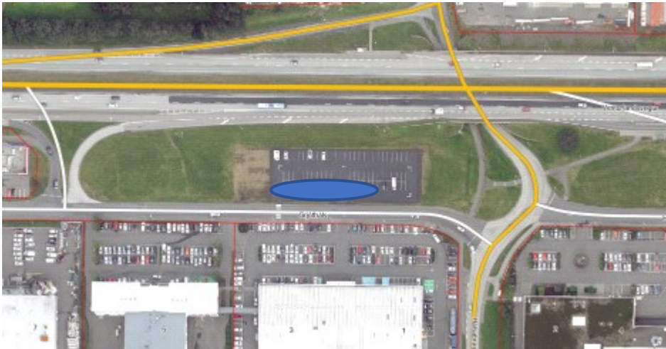
Mynd 3 tillaga að staðsetningu, blár hringur sýnir legu stæða

Suðurlandsveg vegna nálægðar við hann. Staðsetningin er þannig góð m.t.t. samgangna og er fjarri íbúðarhúsum og hefur því lítil grenndaráhrif á íbúa en er vel aðgengileg íbúum í efri byggðum – Grafarholti, Úlfarsfelli, Grafarvogi, Árbæ, Breiðholti, auk Bústaða, Háaleitis og Laugardals. Staðsetningin er að sögn Veitna heppileg m.t.t. háspennudreifikerfis. Í deiliskipulagi fyrir svæðið er gert ráð fyrir gróðri á umræddri staðsetningu, sjá mynd 4, en ekki því bílaplani sem nú er á staðnum. Lagt er til að lóðin geri ráð fyrir 10 stæðum með möguleika á stækkun í 15 hleðslustæði. Þá er lagt til að samhliða skipulagningu lóðar fyrir hraðhleðslu verði umframstæði fjarlægð til samræmis við skipulag.