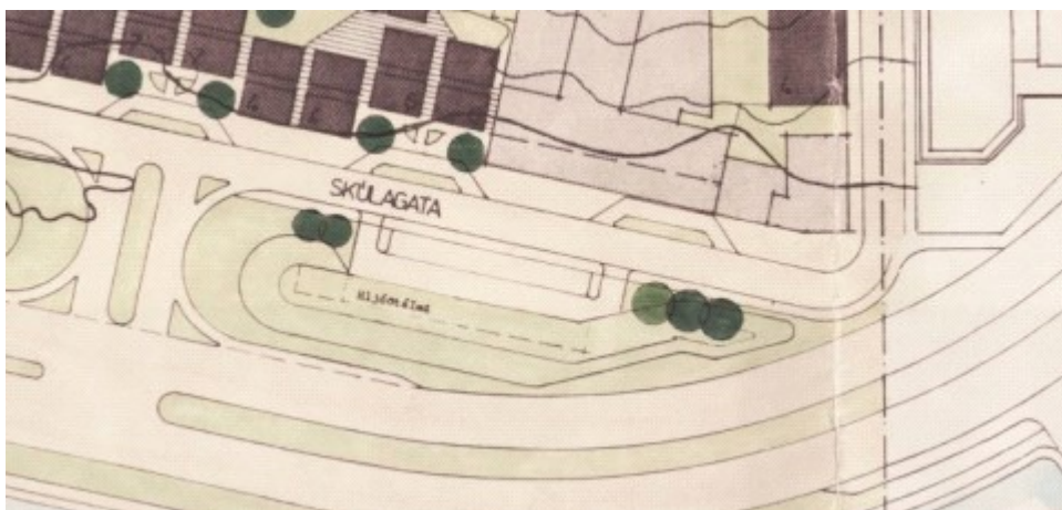
Mynd 2, deiliskipulag við Skúlagötu staðfest 1986