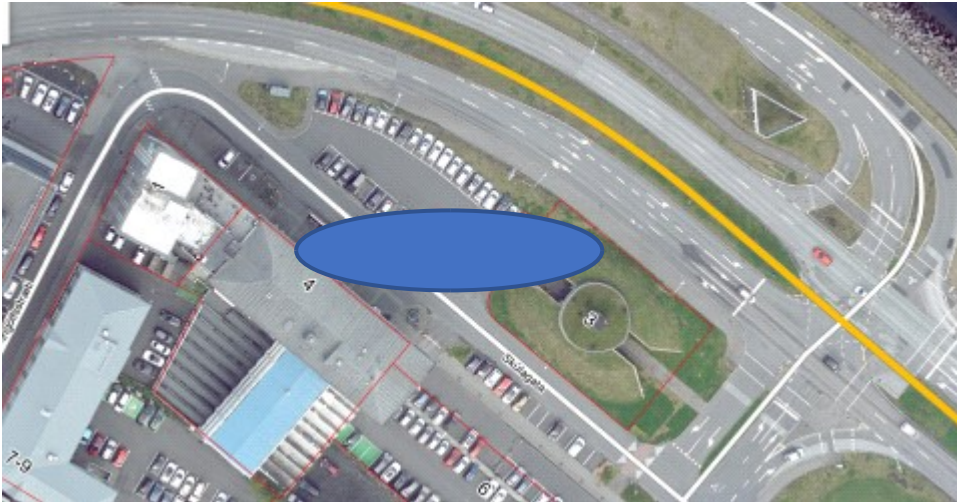
Mynd 1 tillaga að staðsetningu, blár hringur sýnir legu stæða

Lagt er til að hraðhleðslulóð nærri miðborginni verði staðsett á bílastæði til móts við Skúlagötu 2, sjá mynd 1. Með því er verið að nýta bílastæði sem fyrir er. Staðsetningin er góð m.t.t. dreifikerfis rafmagns, frekar stutt er í háspennu – einungis um 15m. Lóðin yrði vel staðsett m.t.t. samgangna við Sæbraut og Skúlagötu og hentar vel m.t.t. nálægðar við gististaði í miðborginni og þá bílaleigubíla sem lagt er í miðborginni. Staðsetningin er fjarri íbúðarhúsum og hefur því lítil grenndaráhrif á íbúa. Á sama tíma hentar hún vel íbúum í Vesturbæ og miðborginni sem ekki eiga stæði á lóð og er einnig ekki svo langt frá Hlíðunum, Norðurmýrinni og Holtunum. Þá liggur staðsetningin vel fyrir leigubíla sem leið eiga í miðborgina. Í gildandi skipulagi er ekki gert ráð fyrir að stæðum næst Sæbrautinni heldur eingöngu stæðum sem standa við Skúlagötu, sjá eftirfarandi mynd. Stæðin næst Skúlagötunni eru 14 í dag sem ætti að nægja fyrir hraðhleðslulóð. Lagt er til að stæðin næst Sæbrautinni verði fjarlægð samhliða skipulagningu lóðar fyrir hraðhleðslu.