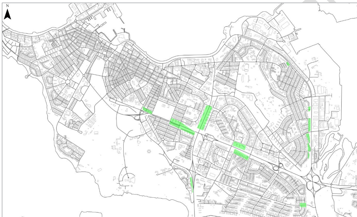
MYND 2 Svæði í förgangi, vesturhluti.

Horft er til svæða þar sem umferðarhávaði veldur íbúum verulegu ónæði og reiknast yfir L_{den} 65 dB, t.d. á stöðum þar sem byggð er í nágrenni við stofnbrautir. Á þeim svæðum verða skoðaðar mögulegar hljóðvarnir eða úrbætur á þegar byggðum hljóðvörnum. Áhersla verður lögð á að bæta hljóðstig við íbúðarbyggð.