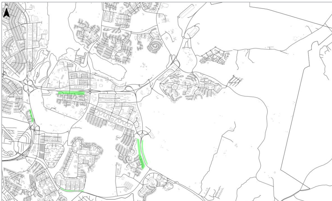
MYND 3. Svæði í forangi, austurhluti.